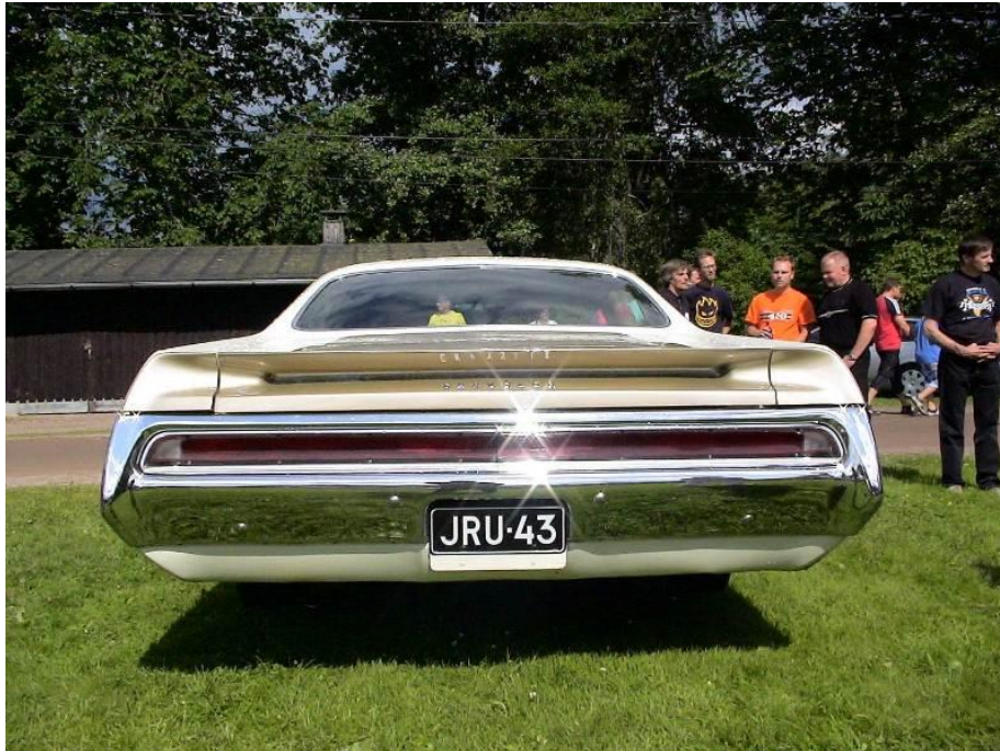
Toni Riskströmin Chrysler 300 Hurst 1970 ei jättänyt ketään kylmäksi Ruukki Pick-Nickissä 2007.