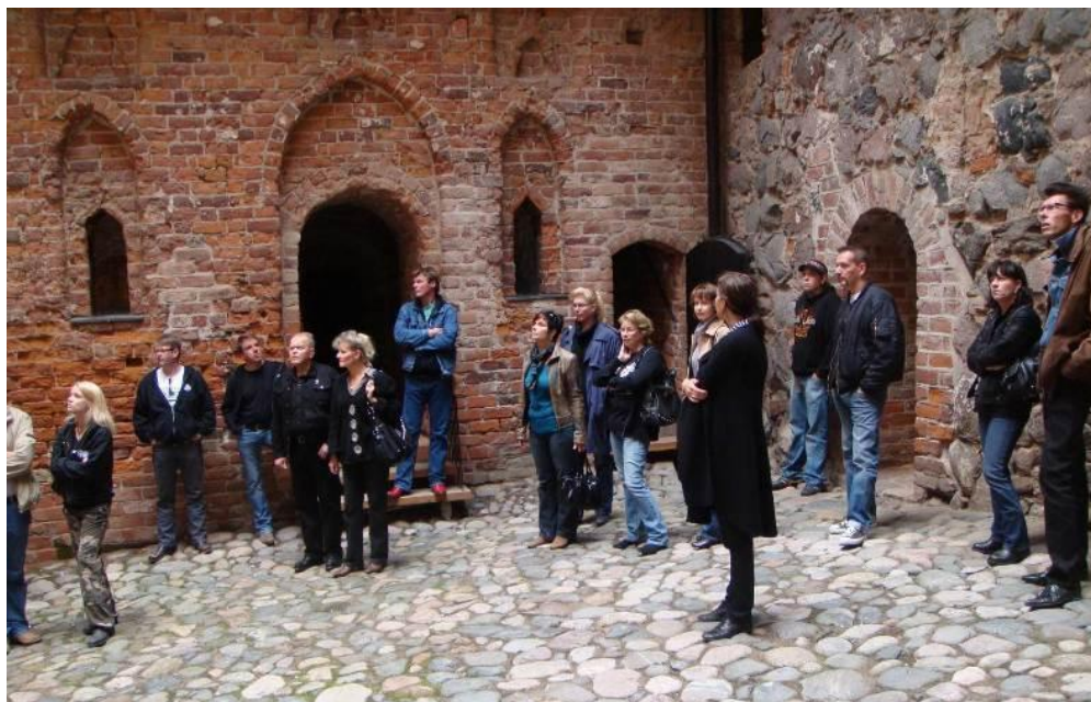
Ajokauden päättäjäisiä vietettiin vuonna 2009 Hämeenlinnassa. Ja ihan kirjaimellisestikin. Kuvassa FMA:n ryhmää kuuntelemassa Hämeen Linnan oppaan hämmästyttäviä kertomuksia keskiaikaisesta elämästä.