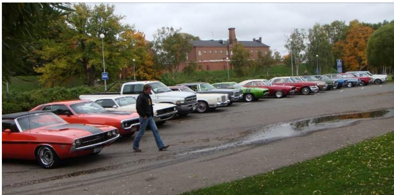
Hämeenlinnan ajokauden päättäjäiset 2009 olivat osaanottajamääränsä puolesta menestys. Autokuntia oli paikalla mukava määrä ja tässä kuvassa osa joukosta parkissa Hämeen Linnan parkkipaikalla.