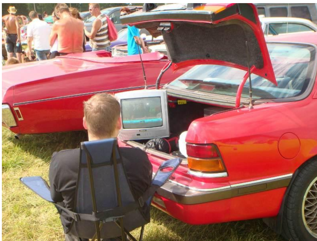
Retkielämää Forssan Pick Nickissä 2010: Nuori herra pelaa viedopeliä Chrysler LeBaron 1989 GTC:n takakontilla. Eihän sitä piknikissä juuri muuta tekemistä olekaan. Autojen pörinä ja liian kirkas valaistus vähän häiritsevät.