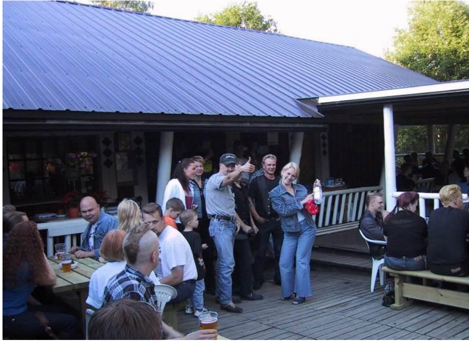
Palvaanjärven Mopar Meetissä jaettiin kilpailujen voittajille hyviä palkintoja, kuten aina FMA:ssa. Kuvassa jonkin kisan (köydenveto?) voittanut joukkue riemuitsee voitosta. Kirkas neste pullossa lienee akkuvettä.