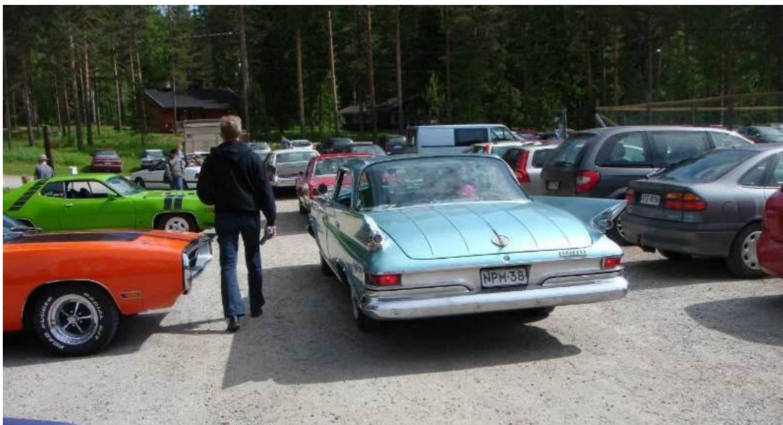
Mopar Meetin tapahtumapaikkana 2010 oli Kerimaan lomakeskus Kerimäellä, Savonlinnan kupeessa. Sää suosi ja päiväkävijöitäkin oli liikkeellä mukavasti.