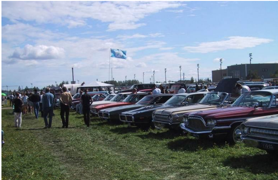
Forssan PickNick'issä 2002 Mopareita oli taas paikalla sankoin joukoin. Harrastaja löysivät FMA:n leiriin salossa liehuvan Chrysler Penta-star lipun opastamina.