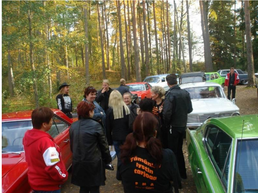
Ajokauden päättäjäiset 2007 oli hieno tapahtuma. Hauskaa pidettiin Forssassa ja lauantapäivän ohjelmaan kuului mm. cruising Liesjärven kansallispuiston hienoissa maisemissa. Lisäksi käytiin tutustumassa Street Machine Club Forssan kerhotalliin. Majapaikkana toimi Rantasipi Forssa.