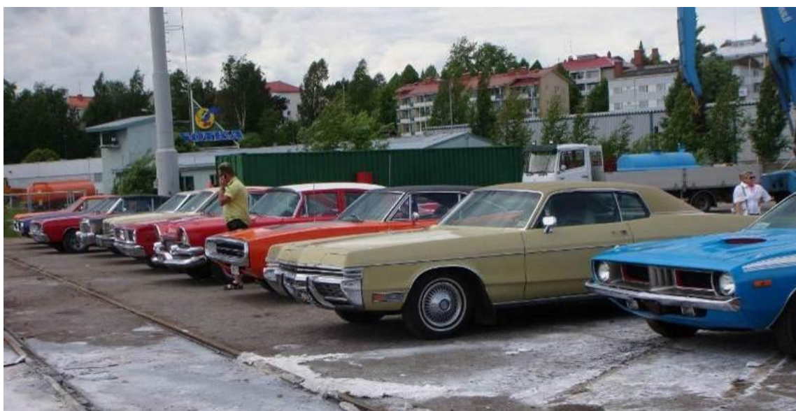
Vuoden 2010 MoparMeetin ohjelmaan kuului risteily Saimaalla Savonlinnan ympäristössä. Mopareille järjestyi parkkipaikka teollisuussatamasta aivan risteilylaivan lähtöpaikan tuntumasta.