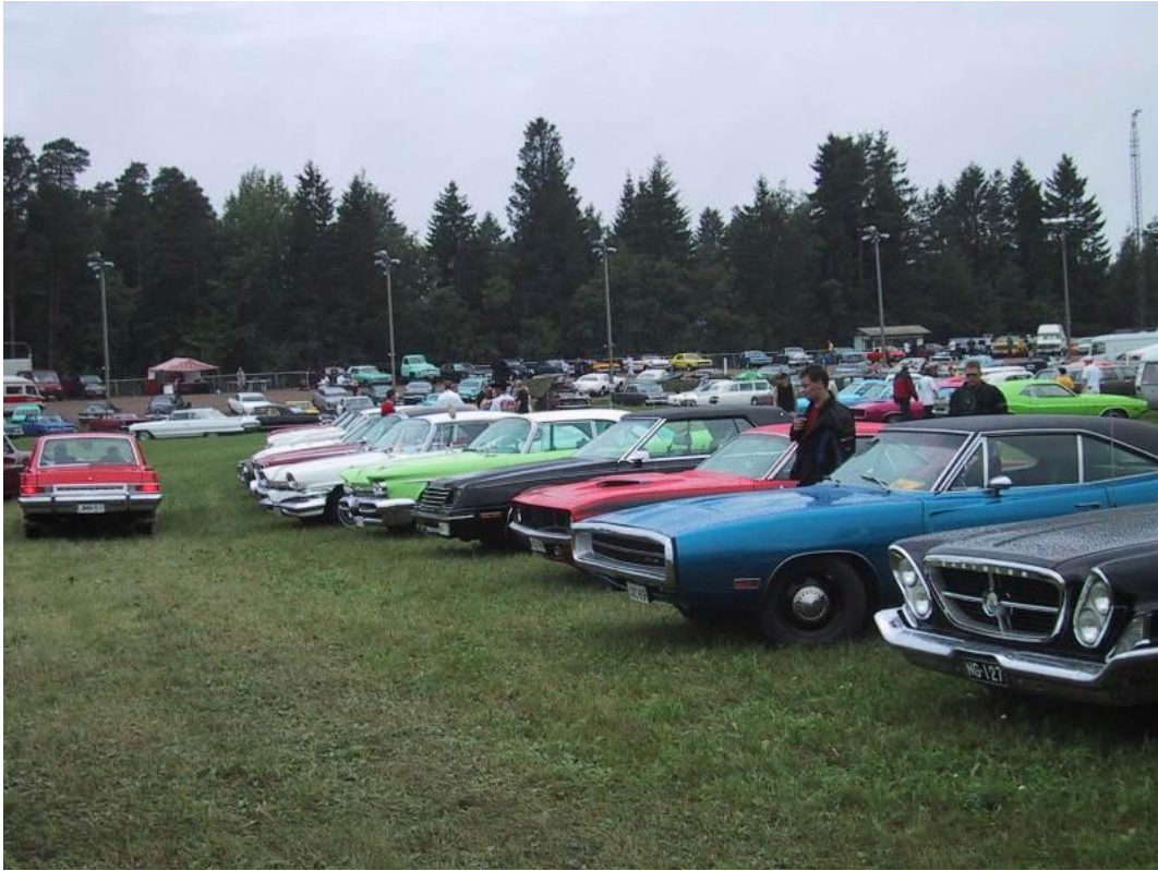
Kalustoa Forssan Picknickissä 3.8.2003. Oikealla olevan mustan -61 Chryslerin 300G:n konepellin päällä helmeilevät pisarat kertovat, että tuolla kerralla saatiin myös vähän vettä niskaan: sehän ei Mopareita haittaa; hienoja Moppeja oli paikalla kymmeniä.